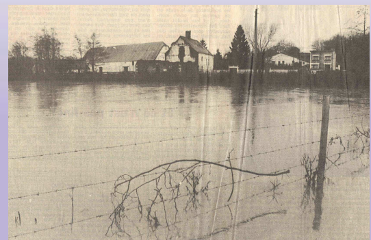
A FERRIERE-LA-PETITE ,décembre 1993