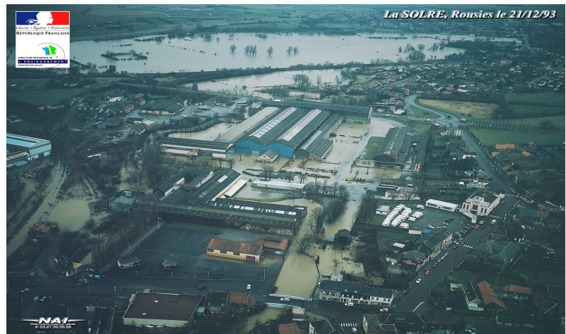
A ROUSIES, Décembre 1993